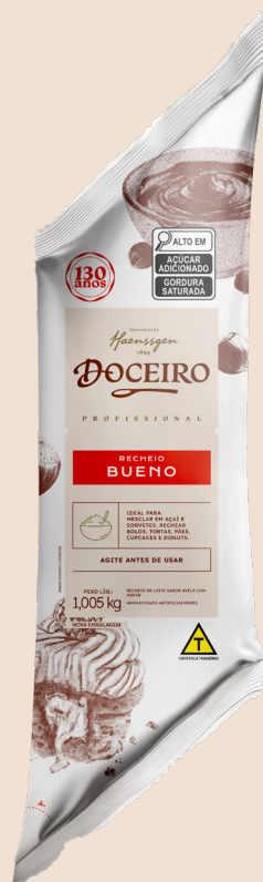
Ref. 1536 Recheio Bueno - Recheio de Leite sabor Avelã com Wafer

Caixa 8 x 1,005kg cada Cód. barras unid: 7896463405390 Cód. barras caixa: 7896463415399 Paletização (base x altura): 17 x 6 caixas Total do Palete: 102 caixas NCM: 19019090