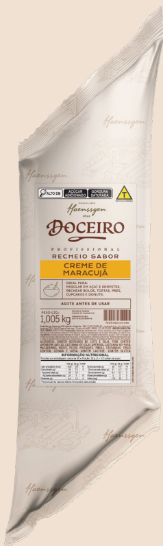
Ref. 1539 Recheio sabor Creme de Maracujá

Caixa 8 x 1,005kg cada Cód. barras unid: 7896463405390 Cód. barras caixa: 7896463415399 Paletização (base x altura): 17 x 6 caixas Total do Palete: 102 caixas NCM: 19019090