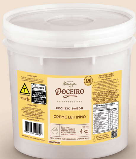
Ref. 1700 Recheio sabor Creme Leitinho

Caixa 8 x 1,005kg cada Cód. barras unid: 7896463405369 Cód. barras caixa: 7896463415368 Paletização (base x altura): 17 x 6 caixas Total do Palete: 102 caixas NCM: 19019090